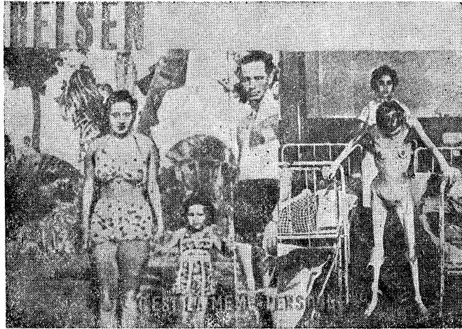
צוויי פּאַטאָגראַפֿיעס: וואָס פֿון אַ פּאַרפּאַלק מיט אַ קינד איז אין קאַצעט געוואָרן...

אויף אַלע שפראַכן פֿון אייראָפּע, אויף איטאַליעניש און אויף ייִדיש, אויף פּויליש און אויף האַלענדיש — פֿרעגן איצט אויגן